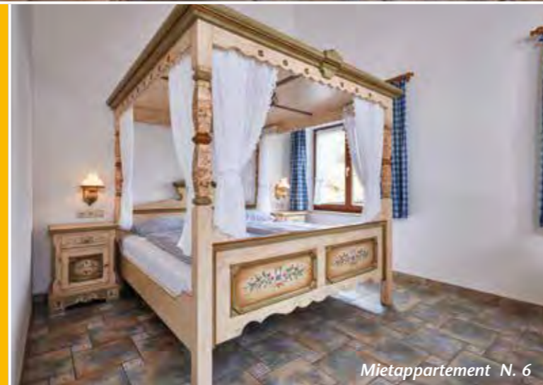
Mietappartement N. 6