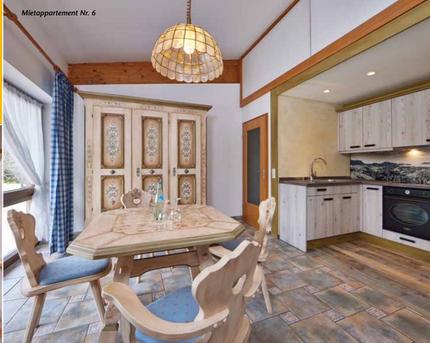
Mietappartement Nr. 6

Mietappartement Genießen Sie unser modernes und stilvolles Ambiente