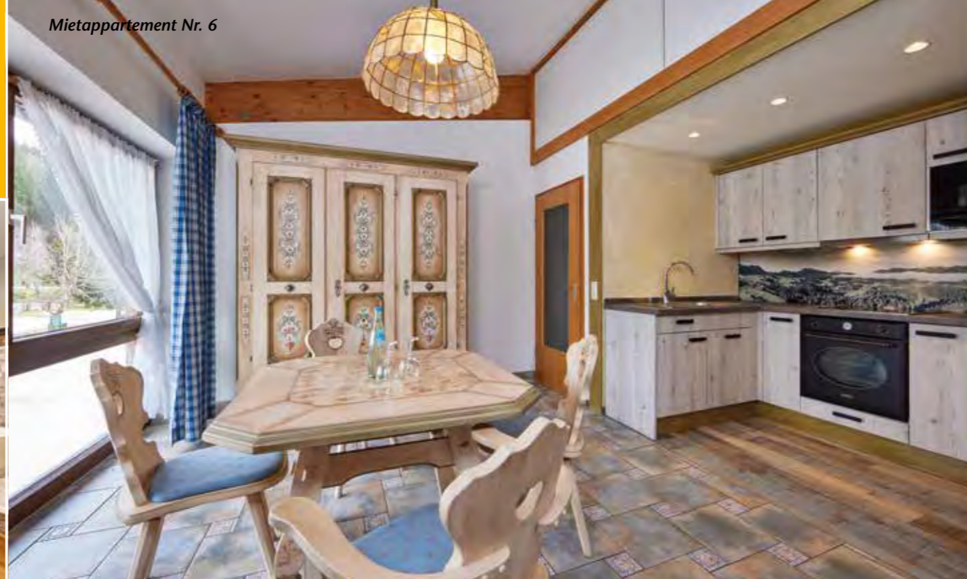
Mietappartement Nr. 6