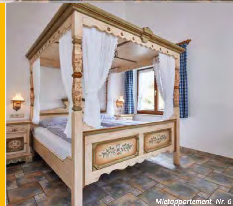
Mietappartement Nr. 6